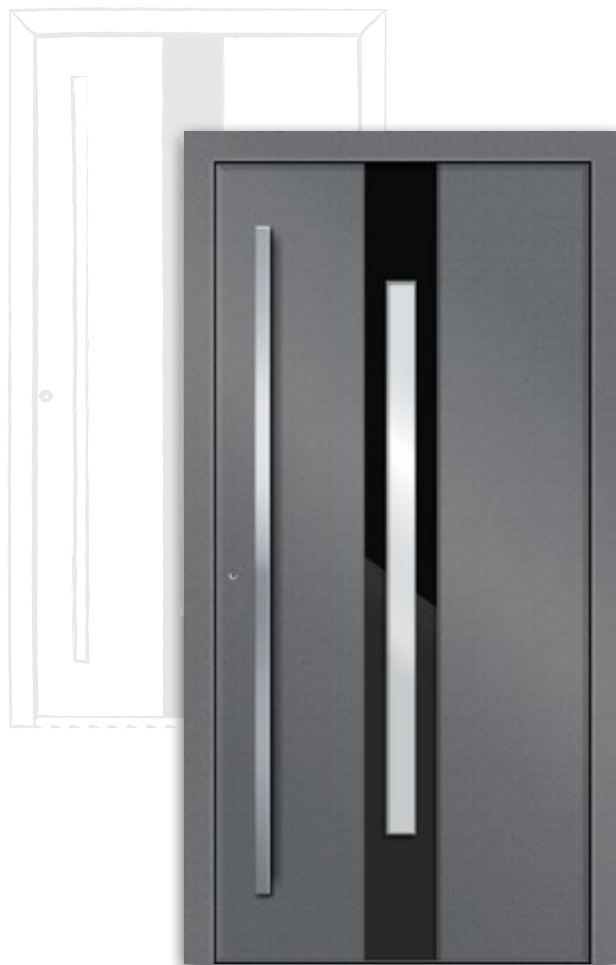
Modell RK 3100